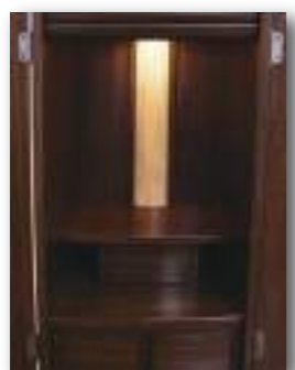
須弥壇を取り外した状態

16号〔寸法〕 本体外寸 高 49×幅36.5(扉二枚折幅51.5cm)×奥38(cm) 御本尊御安置スペース: 高26.5×幅12×奥11(cm) 本尊台: 高1×幅12×奥11(cm)