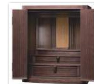
18号 ウォールナット

〔正面表面材〕 台輪・扉：ウォールナット薄板貼り・レンガ無垢 台輪・扉：桜薄板貼り・レンガ無垢