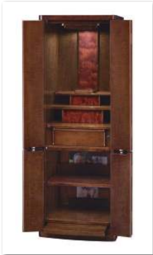
40号 カーリーメープル ブラウン