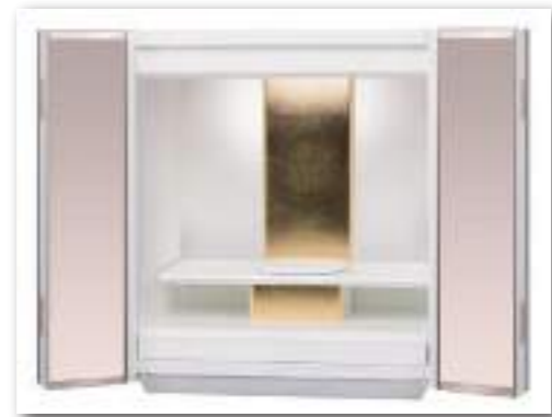
ミラー × ホワイト