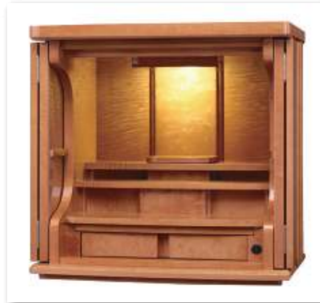
カーリーメープル ナチュラル