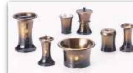
桜 彫金 コハクボカシ