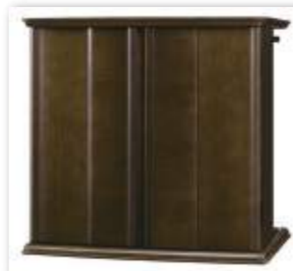
19号 ダークブラウン