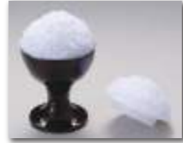
ごはん部分 直径:4.9×高2.7cm 軸部分 直径:3.0×高0.6cm