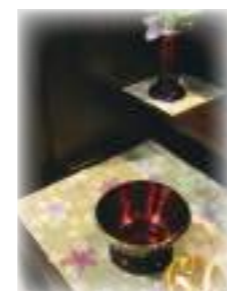
防災お仏壇マットと花台敷き