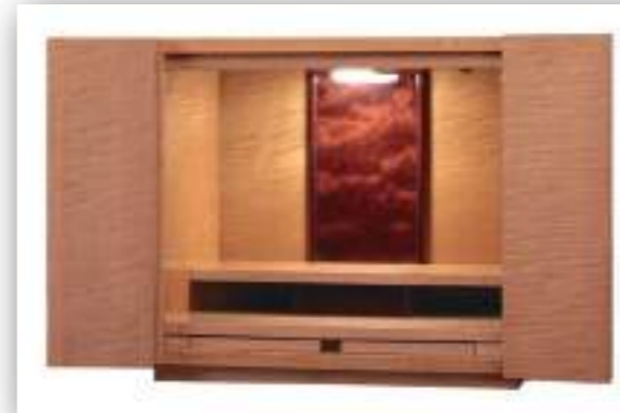
14号 カーリーメープル ナチュラル