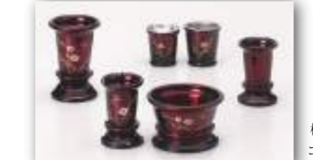
梅 彫金 コハクボカシ・ワインボカシ