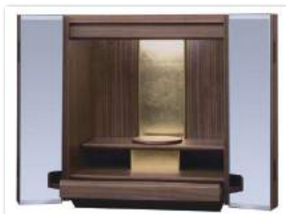
ミラー × ウォールナット