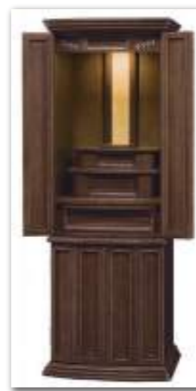
50号 ダークブラウン