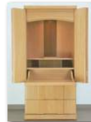
須弥壇上段を取り外した状態