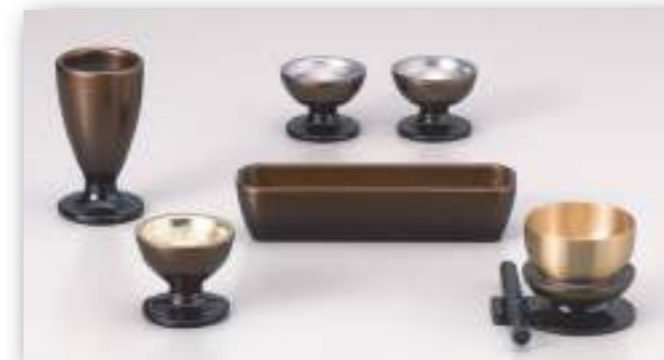
大 コハクボカシ 角香炉セット