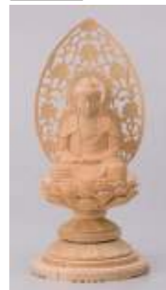
桜丸台座 釈迦如来 2.5寸