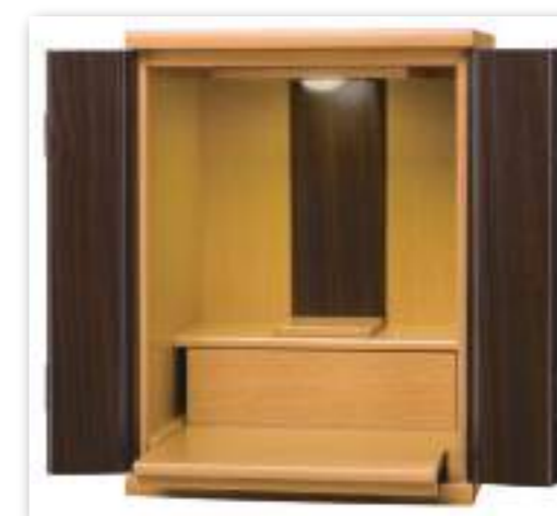
オーク×ウォールナット