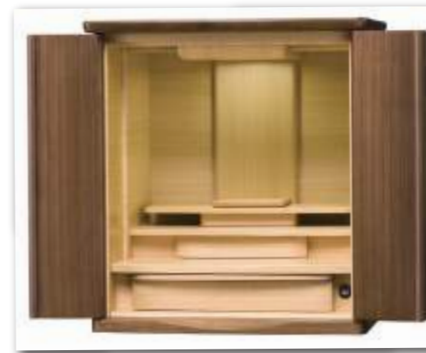
18号 ウォールナット×タモ