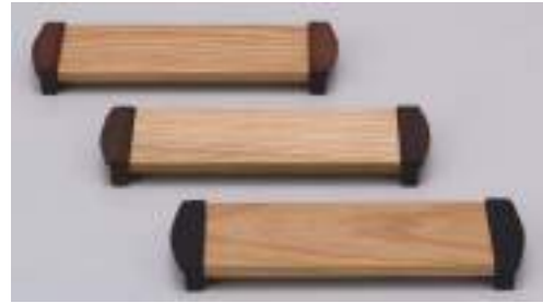
上から紫檀・ウォールナット・黒檀