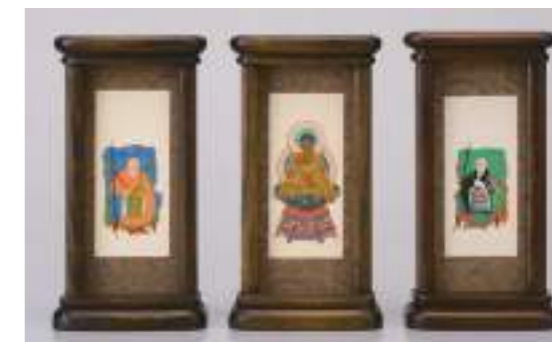
写真は曹洞宗 スタンド掛軸(小)オーク