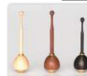
メープル 花梨 黒檀