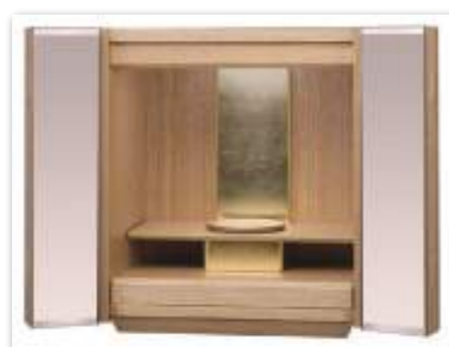
ミラー × タモ