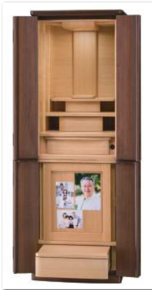
43号 ウォールナット×タモ