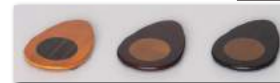
アッシュ 紫檀 黒檀