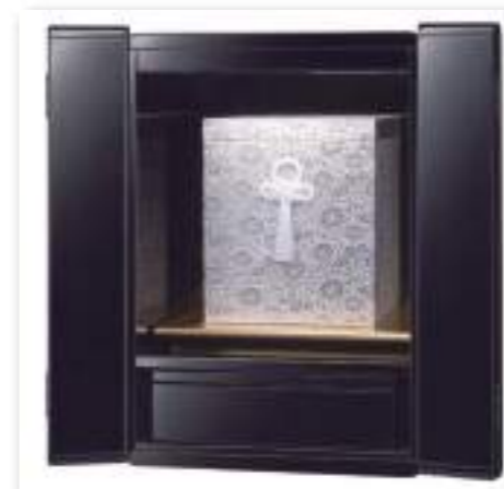
ブラック 骨壺入れとして