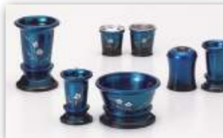
梅 彫金 ブルーボカシ