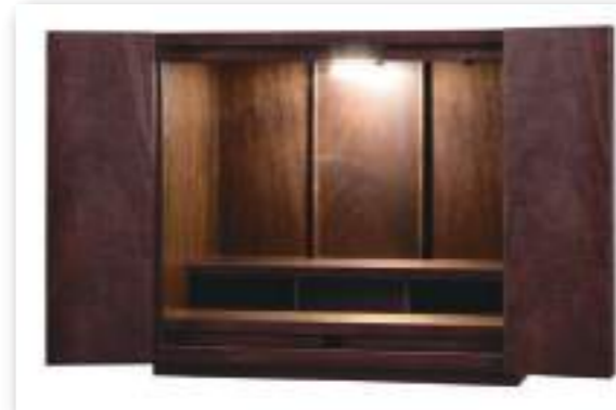
14号 ウォールナット