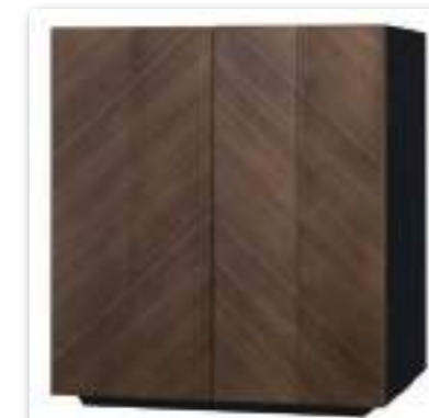
ウォールナット × ブラック