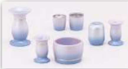
パールスカイブルー