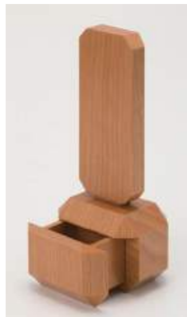
位牌裏側にはメモリアルBOXがごございます。

全ての面において理想的な柵目を表現するため、あえて突板の貼り合わせて作られており、これには非常に高い木工技術が求められます。この商品は静岡の若き木工職人と弊社の塗装により作られた国産品です。