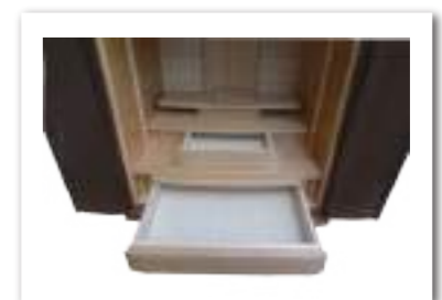
18号 引出しを出した状態

「桜象嵌(ぞうがん)」には、桜の花びらの形に彫った溝に天然漆を埋め込む象嵌細工を施しています。表面を触っても平になっています。