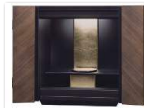
ウォールナット × ブラック