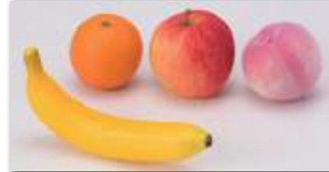
バナナ 長さ約19.5cm・オレンジ 大きさ:7.5×7.5cm りんご 大きさ:8.5×8.5cm・もも 大きさ8×8cm