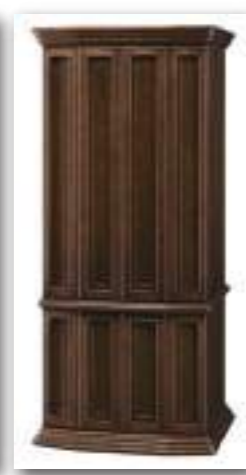
40号 ダークブラウン