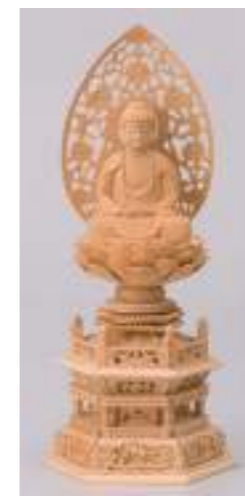
桜六角座 釈迦如来 2.0寸