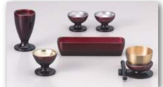
大 ワインボカシ 角香炉セット