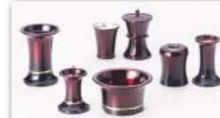
金筋入り ワインボカシ