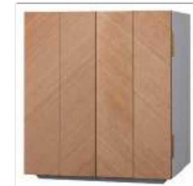
タモ × ホワイト