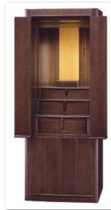
43号 ウォールナット

〔正面表面材〕 台輪・扉 ウォールナット薄板貼り 〔表面仕上げ〕 ウレタン塗装 〔主芯材〕 木質繊維板 〔原産国〕 海外