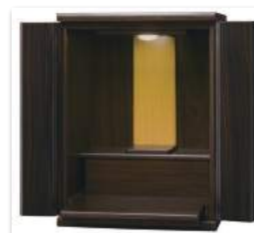
ウォールナット×黒檀