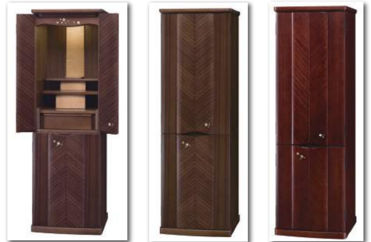
蘭 ウォールナット