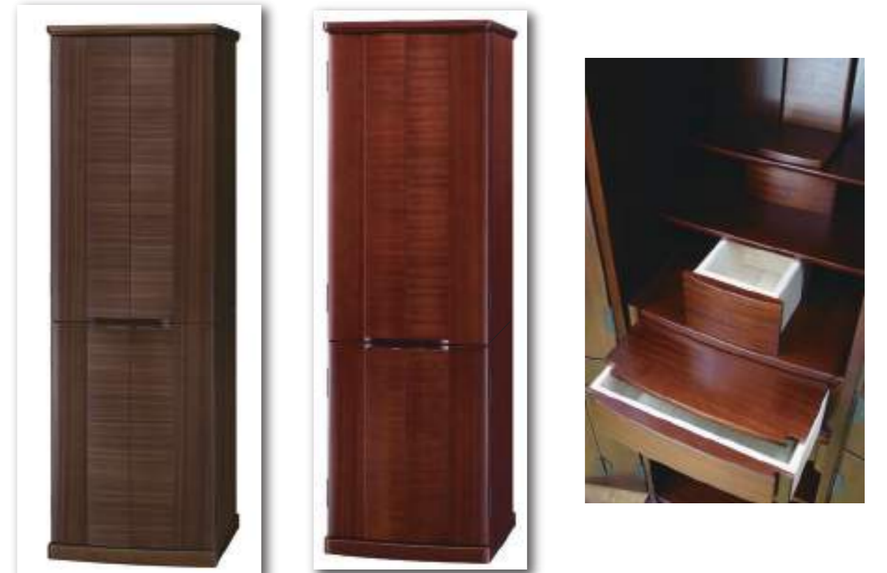
杏 ウォールナット