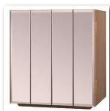
ミラー × タモ