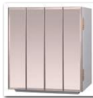
ミラー × ホワイト