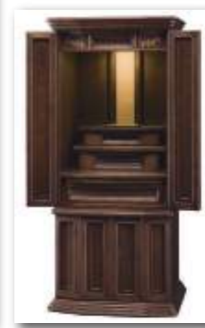
40号 ダークブラウン