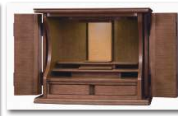
16号 ダークブラウン