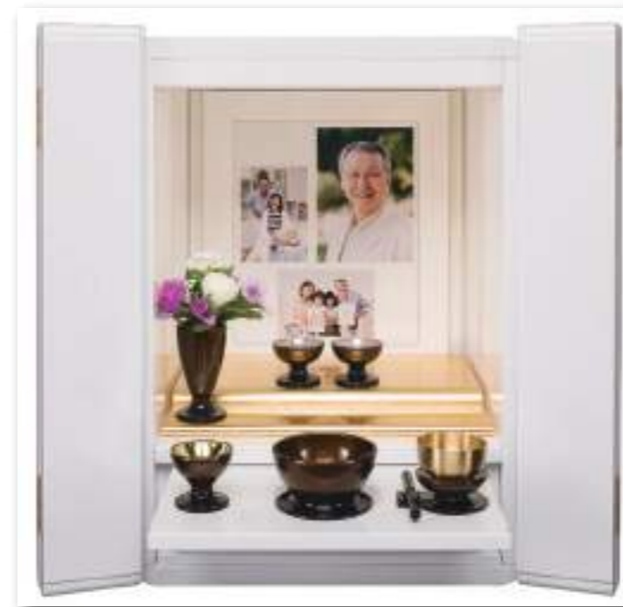
ホワイト 手元供養として