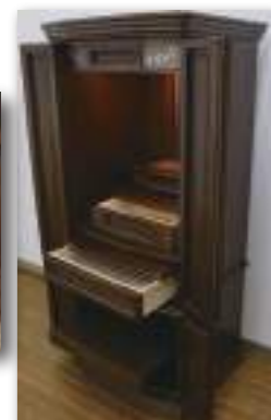
40号 ダークブラウン

〔正面表面材〕 ウォールナット 台輪・扉：ウォールナット薄板貼り 桜 台輪・扉：桜薄板貼り 〔寸法〕 本体外寸：高135×幅44(扉二枚折幅64.5)×奥46.5(cm) 御本尊御安置スペース：高37×幅15.5×奥14(cm) 本尊台：高1×幅13.5×奥13.5(cm)