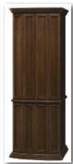
50号 ダークブラウン