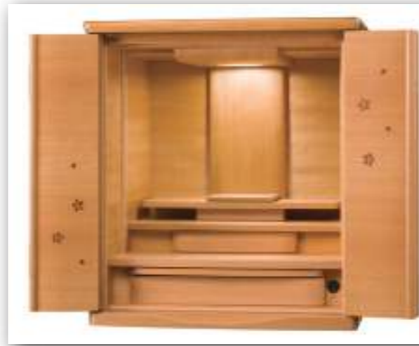
18号 桜象嵌(ぞうがん)