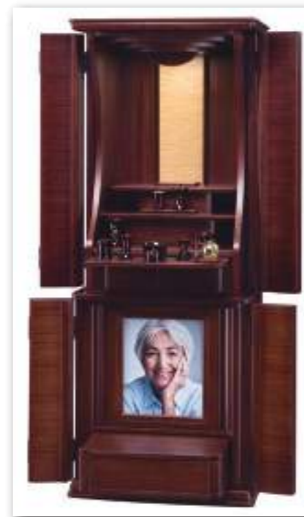
50号 遺影壇 ダークレッド (須弥壇を1段取り外した状態)