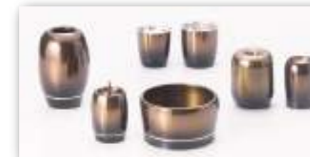
金筋入り コハクボカシ