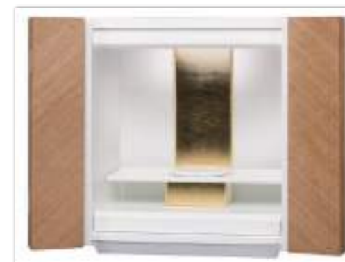
タモ × ホワイト