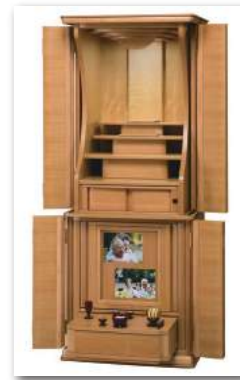
50号 遺影壇 桜