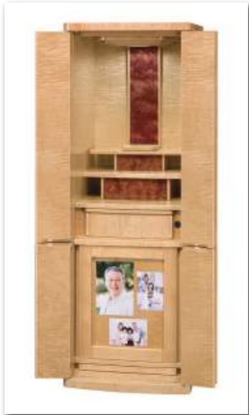
40号 カーリーメープル ナチュラル