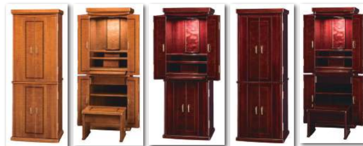
カーリーメープル ワインレッド

〔正面表面材〕 カーリーメープル ライトブラウン : 台輪 カーリーメープル薄板貼り 扉 バースアイメープル薄板貼り・カーリーメープル薄板貼り・象嵌 カーリーメープル ワインレッド : 台輪 カーリーメープル薄板貼り 扉 プビンガ薄板貼り・カーリーメープル薄板貼り・象嵌