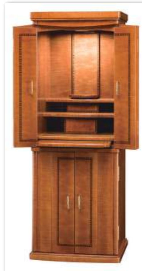
カーリーメープル ライトブラウン