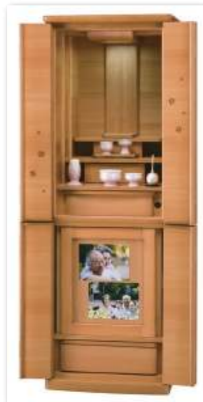
43号 桜象嵌(ぞうがん)