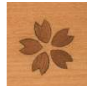
43・18号 桜象嵌(ぞうがん)

「桜象嵌(ぞうがん)」には、桜の花びらの形に彫った溝に天然漆を埋め込む象嵌細工を施しています。表面を触っても平になっています。