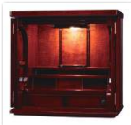
カーリーメープル ワインレッド