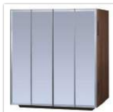
ミラー × ウォールナット