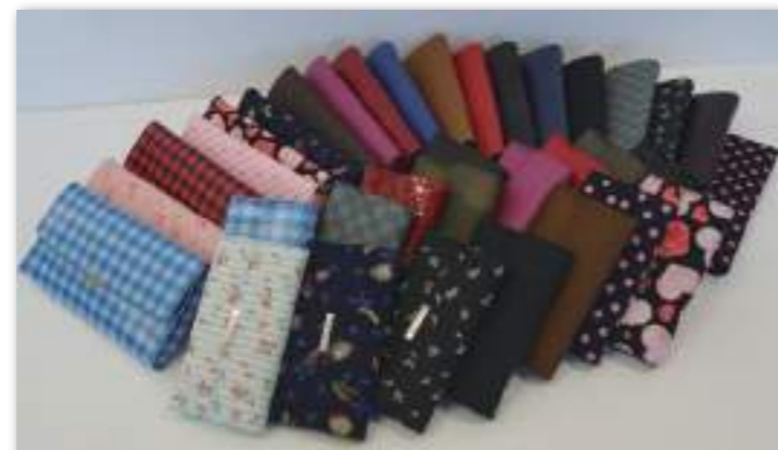
小:縦8.5×横15×厚1.5(cm) 大:縦10.5×横19.5×厚2(cm)