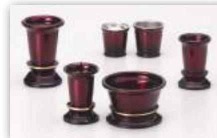
金筋入り ワインボカシ