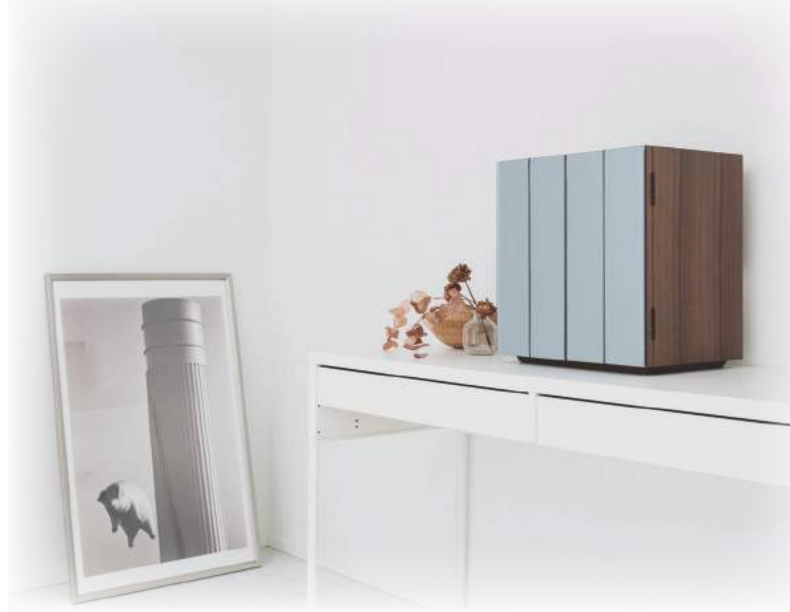
モダン仏壇カタログ