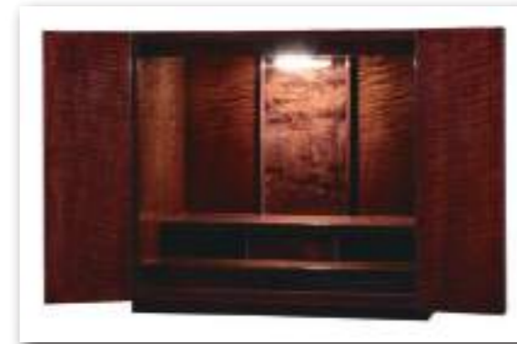
14号 カーリーメープル ブラウン