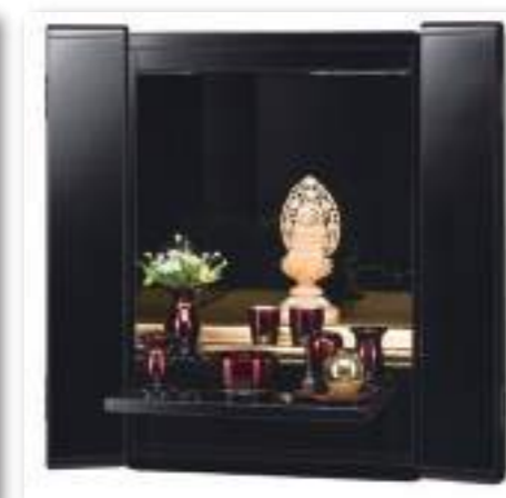
ブラック 仏壇として