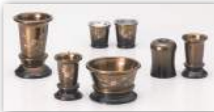
枝桜 彫金 コハクボカシ・ワインボカシ