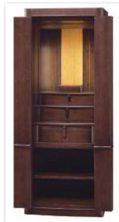
43号 ウォールナット