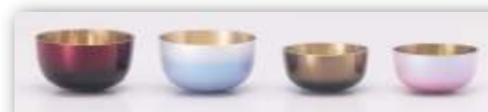
ワインボカシ パールスカイブルー コハクボカシ パールピンク