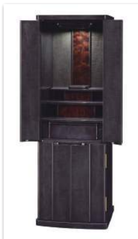
40号 カーリーメープル ブラック