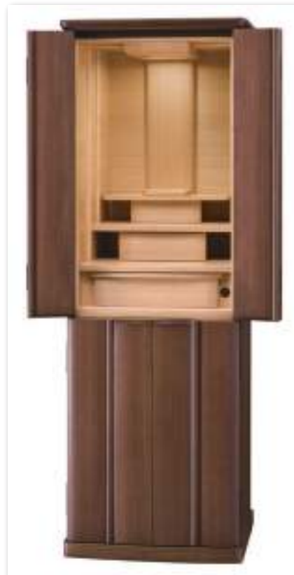
43号 ウォールナット×タモ