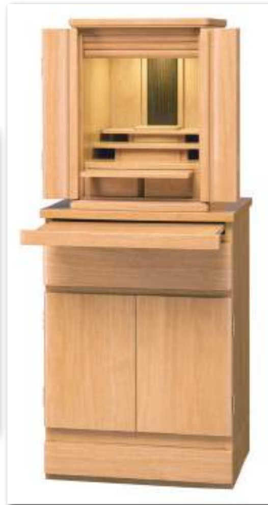
キッカ16号を置いた状態 増台付 ライト