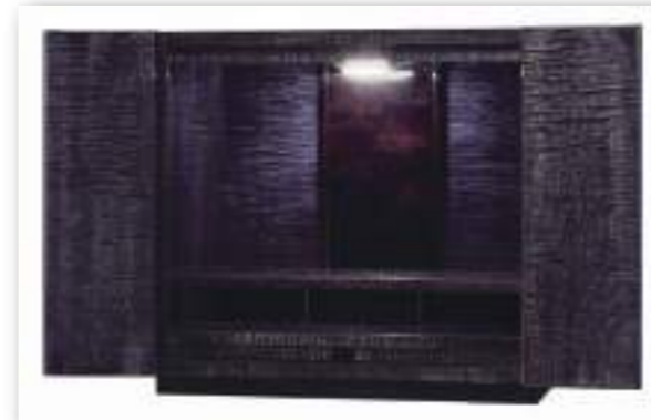
14号 カーリーメープル ブラック