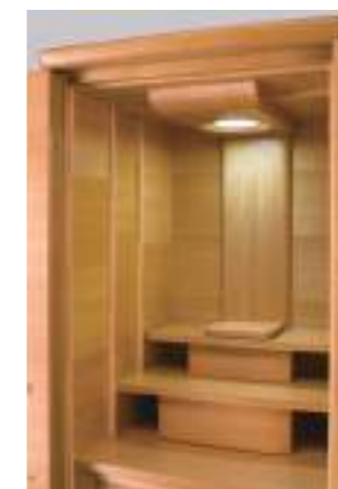
43号 桜象嵌(ぞうがん)