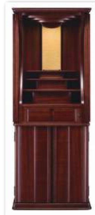
50号 遺影壇 ダークレッド