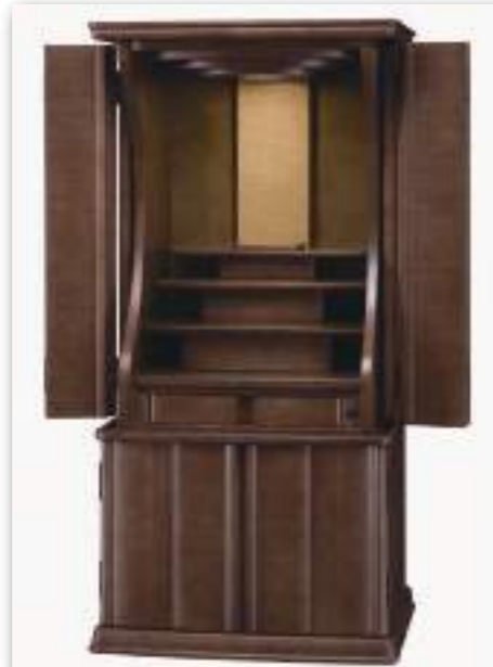
40号 ダークブラウン