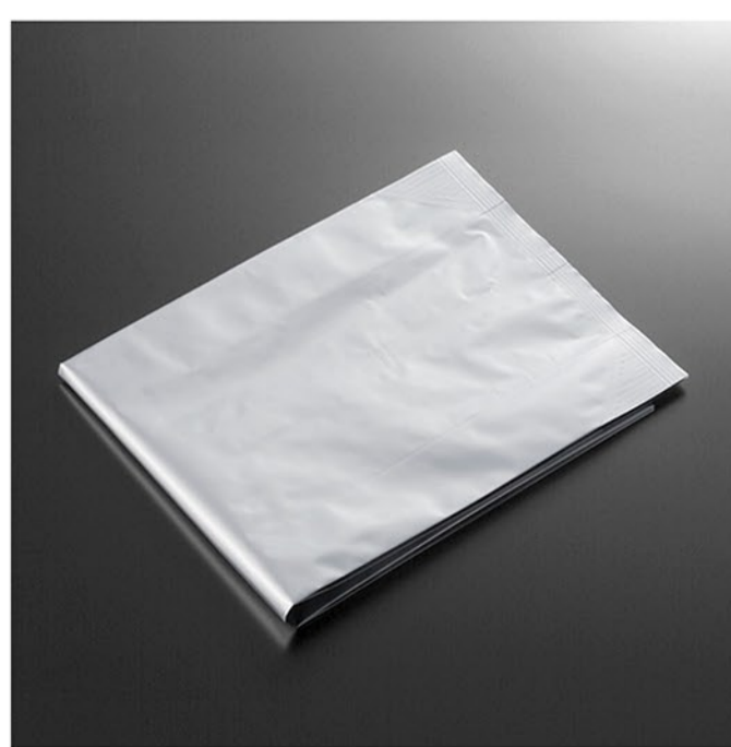
アルミ骨袋 熱シーリングによる密封も可能 遺骨を外気から遮断できます。