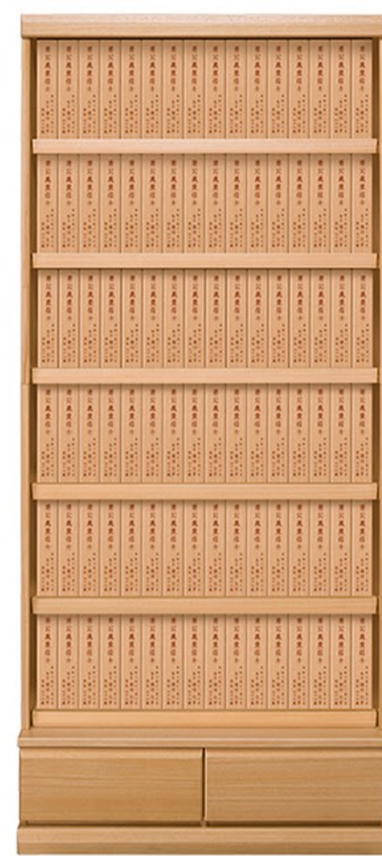
棚：SP1F W904 H2070 D450 骨箱：BCP1F 焼香台：TP1F