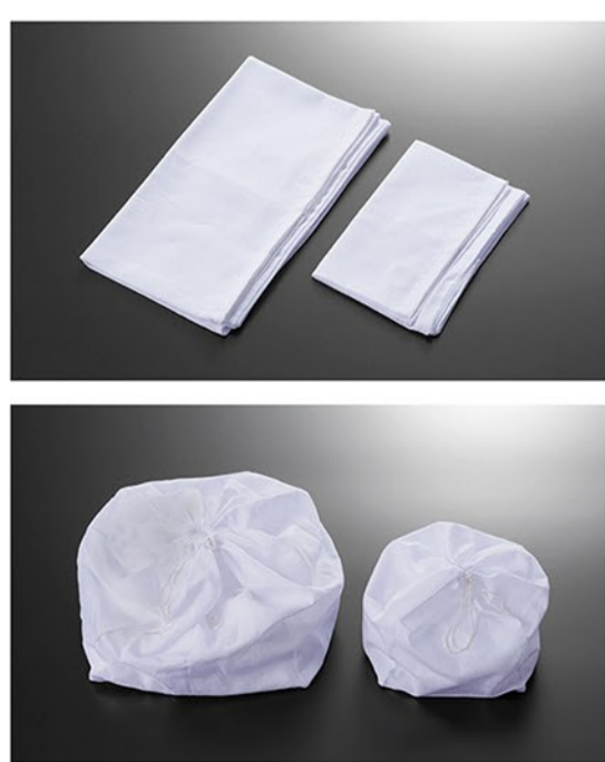
綿製骨袋 大・小 骨袋は形状に合わせて広がります。 ひも付き。

7寸の骨壺と同様量の空間を確保した骨箱。粉骨せず、焼骨のまま収納可能です。 湿気対策のためアルミ骨袋（別売）にお入れしてのご納骨をおすすめします。